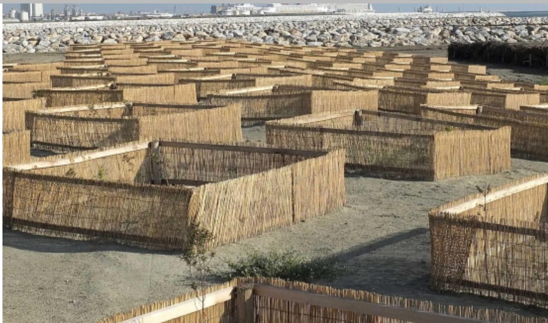
Un'immagine della spiaggia libera a ridosso dello Scolmatore a Calambrone con i recinti a protezione delle piantumazioni

CALAMBRONE. Se da un lato la realizzazione della darsena armata dello Scolmatore, con un “pennello” che si addentra nel mare per circa 700 metri, con ogni probabilità ha determinato un arretramento degli arenili fino a raggiungere in alcuni casi anche i 20 metri, dall'altro ha senza dubbio comportato un giovamento per la spiaggia libera che costeggia per un tratto lo Scolmatore. Quella spiaggia una decina di anni fa venne inaugurata come spiaggia libera con accesso ai cani. All'epoca era un'assoluta novità, dal momento che in quegli anni nessun stabilimento era attrezzato per ospitare anche gli animali.