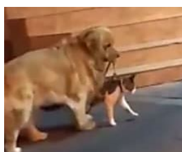
Cina, il gatto sta per azzuffarsi: cane lo trascina via ed evita la 'rissa'