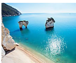
Puglia, ecco le 6 località dove preferiscono comprar casa gli stranieri