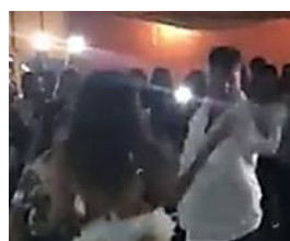
Palermo, si scatena con la ballerina: la moglie irrompe e lo picchia